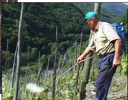
Il trattamento con lo zolfo