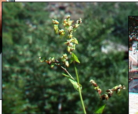
Il grano saraceno al momento della mietitura