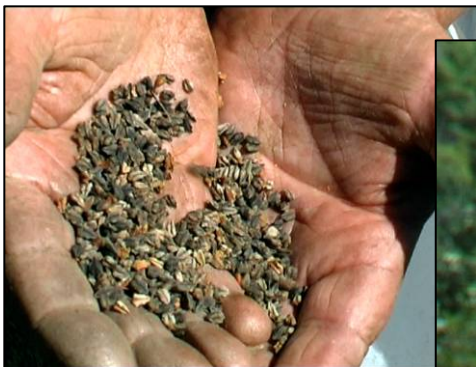
I semi pronti per la semina